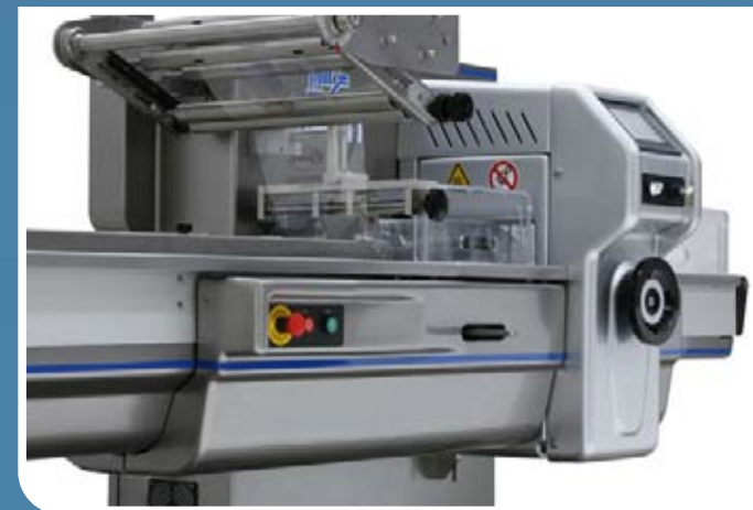
Dispositivo di formatura / Adjustable forming box

Fin seal assembly including three sets of rollers: film pulling, film sealing complete with automatic opening at machine stop and fin seal foldover.